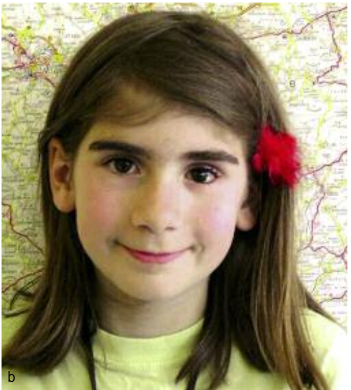
Abb. 3a und b: a) Moderne Kunststoffe finden in der Hilfsmittelversorgung von Kindern mit Augenprothesen erfolgreiche Anwendung. In der Pädiatrie sind mit den neuartigen Kunststoffaugen gute Ergebnisse zu erzielen. b) Bei Kindern muss gewährleistet sein, dass die Augenprothese auch als Expander die aktive Aufgabe und Funktion zur Regulierung und Förderung der Wachstumsprozesse des betroffenen Gesichtsschädelareals übernimmt. Ansonsten besteht die Gefahr deutlicher Gesichtsdeformationen durch ungleiches Wachstum